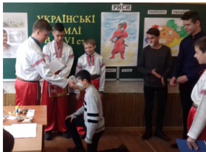
Фото №3-4. Інсценування «Посвята у козаки»