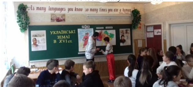
Фото №2. «Кращий знавець карти»