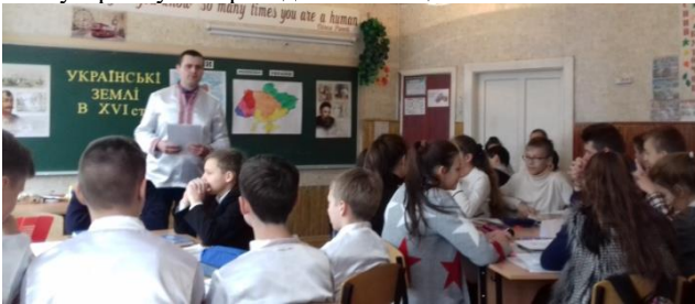
Фото №1. Розподіл класу на команди

3-я команда. Показати на карті українські землі, які увійшли до складу Речі Посполитої після Люблінської унії 1569 р. Який адміністративно-територіальний устрій був запроваджений на цих землях?