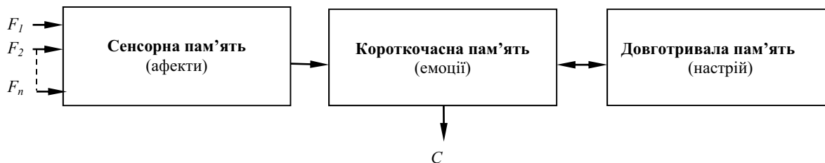
Рис. 2. Комбінована система розпізнавання образів, що реалізує представлену модель пам'яті

Виходячи з концепції комбінованих систем [9], кожна функціональна залежність (1) з різною вірогідністю дозволяє віднести об'єкт до одного й того ж класу P . Тоді емоційні характеристики, як ступень зміни стану, будуть визначатися в диференціальному вигляді як